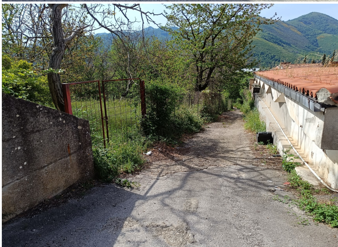
Foto 9-10: Visuali da Via Tufara angolo Nord Cimitero esistente accesso nuovo parcheggio da realizzare