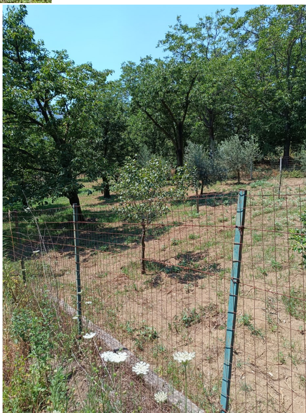
Foto 13: Visuale da nuovo parcheggio da realizzare-casolare contiguo