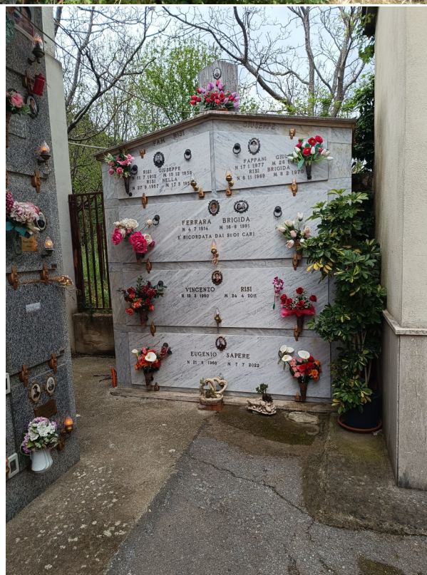
Foto 7: Visuale da 1° terrazzamento da realizzare Cimitero esistente