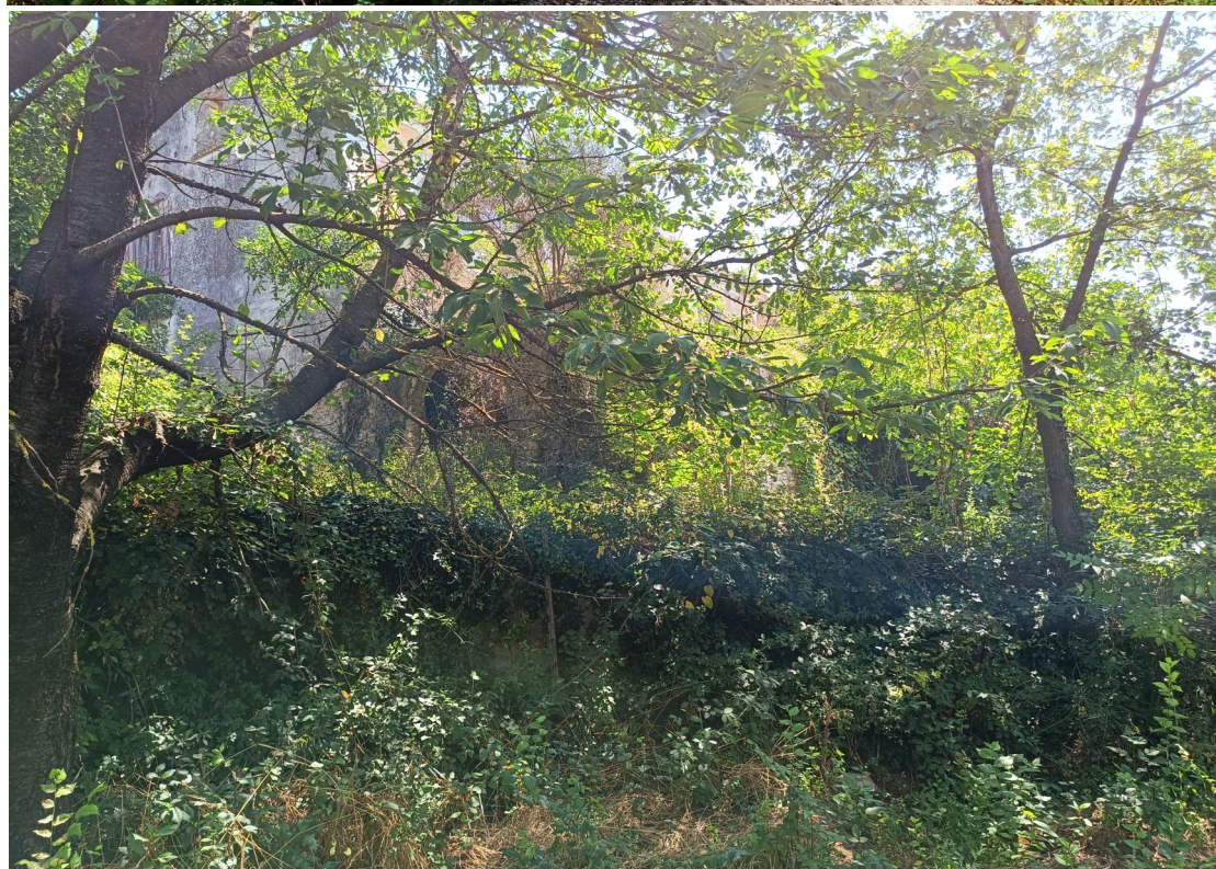
Foto 11: Visuale da Via Tufara contigua pubblico Cimitero esistente nuova strada da ampliare