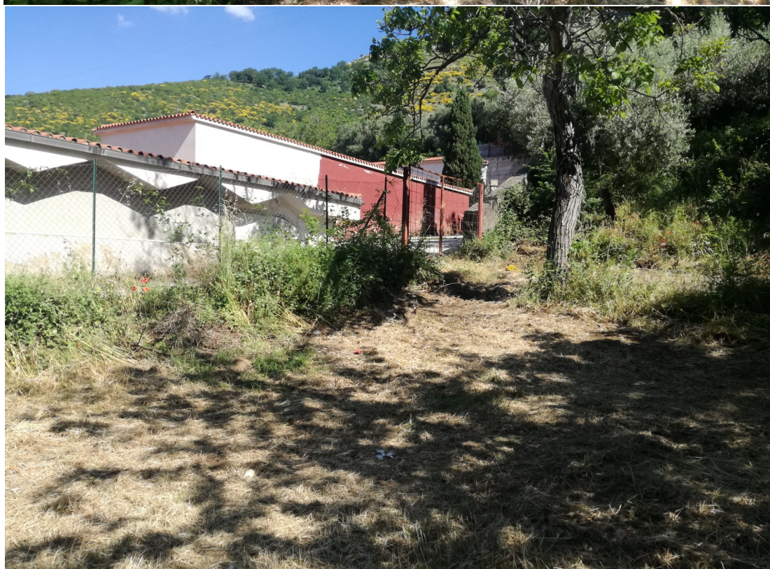
Foto 3: Visuale posizionamento nuovo parcheggio da realizzare lato NORD

Foto 4: Visuale da 1° terrazzamento da realizzare loculi e ossari Cimitero esistente