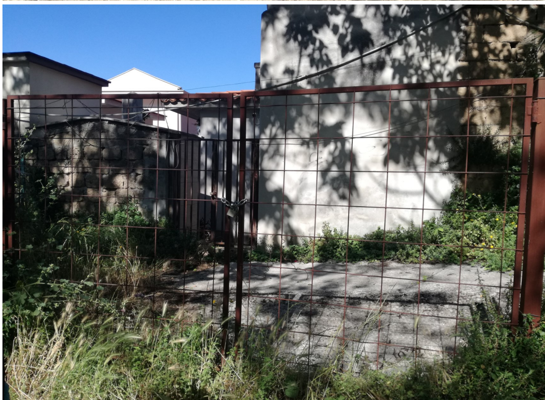
Foto 5: Visuale da 1° terrazzamento da realizzare loculi e ossari Cimitero esistente