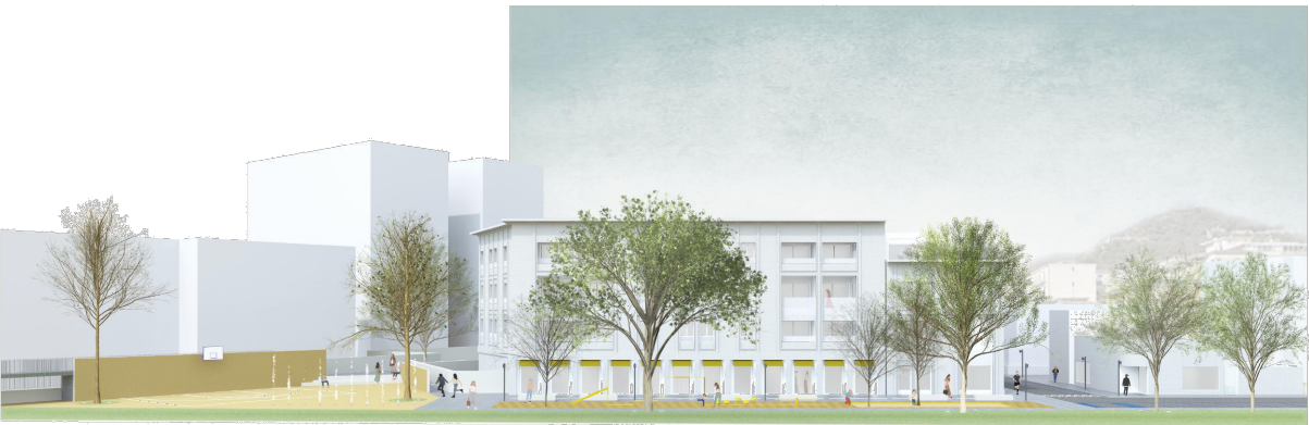
Tavola in modifica e sostituzione dell'analogata acquisita al protocollo 31017 in data 18/12/2023

CITTA' DI MERCATO S. SEVERINO PROVINCIA DI SALERNO