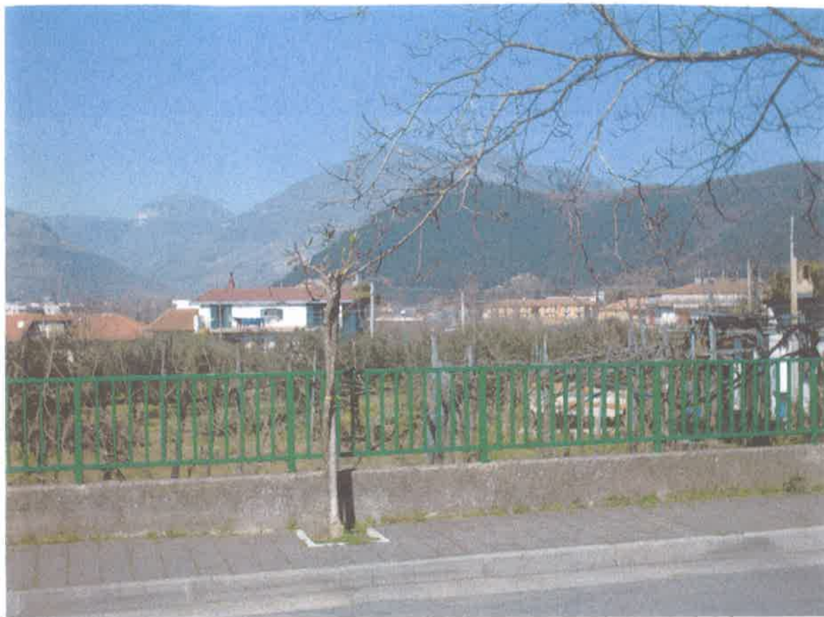
FOTO LUNGO VIA BRECCIOSA