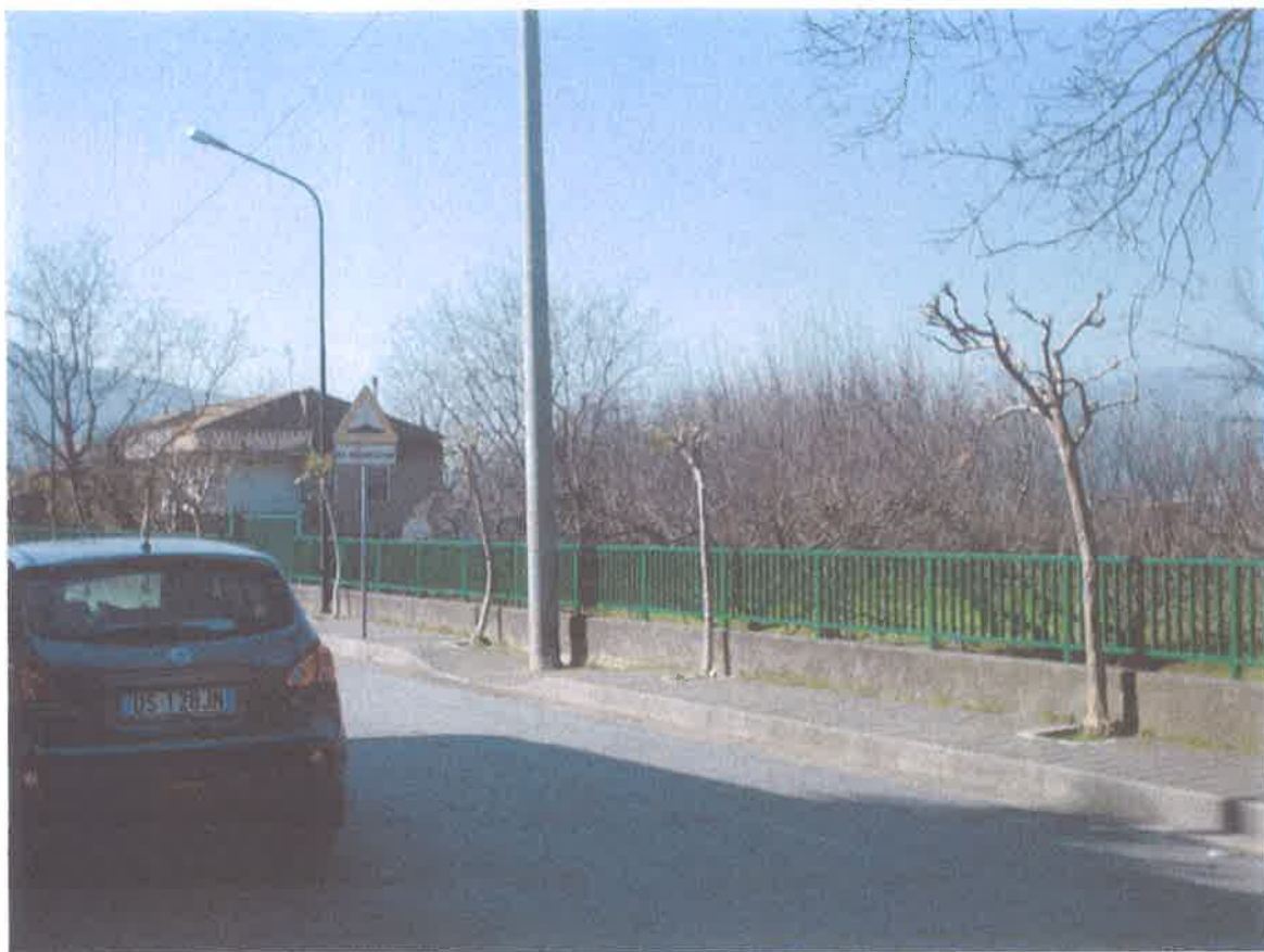
FOTO LUNGO VIA BRECCIOSA